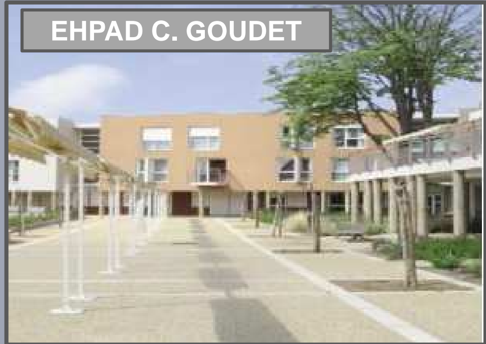
EHPAD C. GOUDET