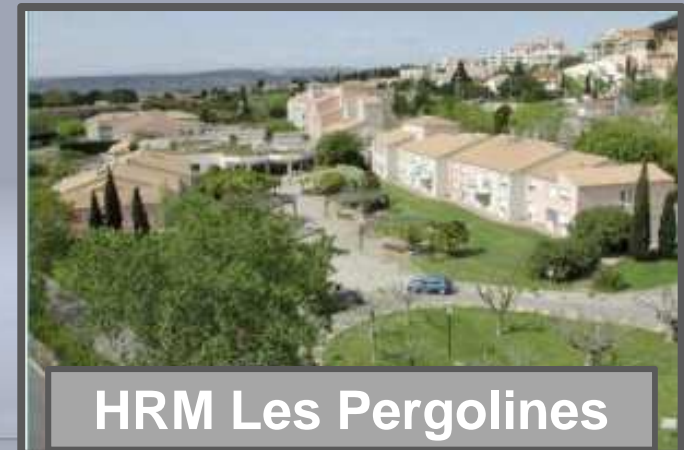
HRM Les Pergolines