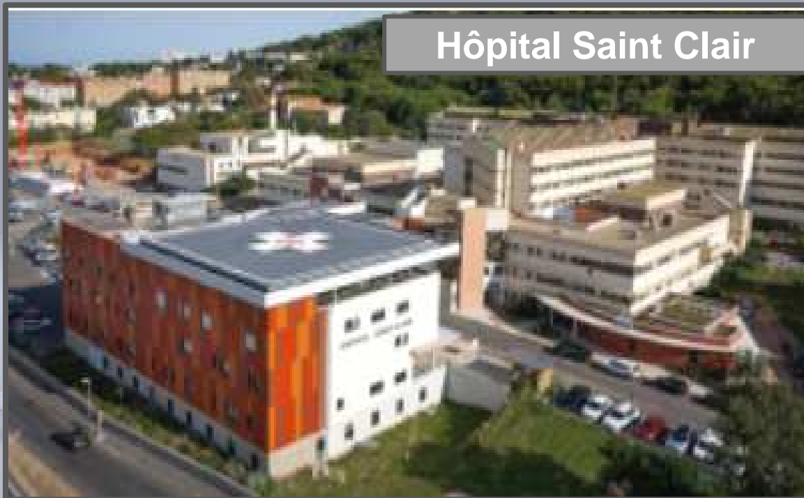
Hôpital Saint Clair