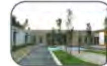
EHPAD Simone de Beauvoir (Détachement d'habitat pour personnes âgées dépendantes) 9 avenue du Péras 34370 Cazouls-les Béziers