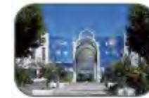
Site principal Montimaran 2, rue Valentin Hadjy 34500 Béziers