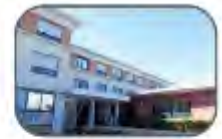
Centre Psychothérapique Camille Claudel Rue Rivetti 34500 Béziers