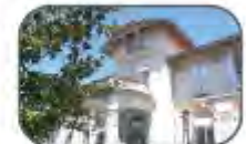
Espace Perréal 2 Bd Ernest Perréal ou 2 Bd du Dr Albert Mourrut 34500 Béziers