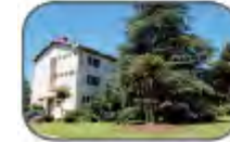
Institut de Formation aux Métiers du Soins (IFMS) 21 Bd Kennedy 34500 Béziers