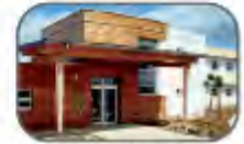
Unité de Psychiatrie Enfant et Adolescent Anne Frank Rue du r Cl. Dimitri Amilakvari 34500 Béziers