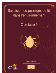
Punaises de lit dans l'environnement