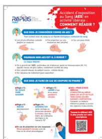
CAT en cas d'AES, RéPias PRIMO