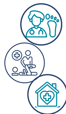
Outils par spécialité