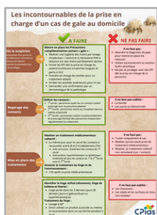
Gale : les incontournables

Pour former ses pairs, la version pédagogique proposée en complément inclut un film interactif (questions-réponses et argumentaires) et un quiz en ligne pour tester ses connaissances