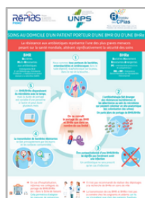
Soins à domicile BMR RéPias PRIMO