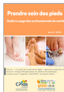
Prendre soin des pieds