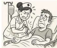
Cathéter veineux périphérique - Digistorm by La Digitale Code qzdkur